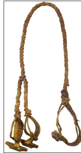
Resim 10:  ider (k stek)