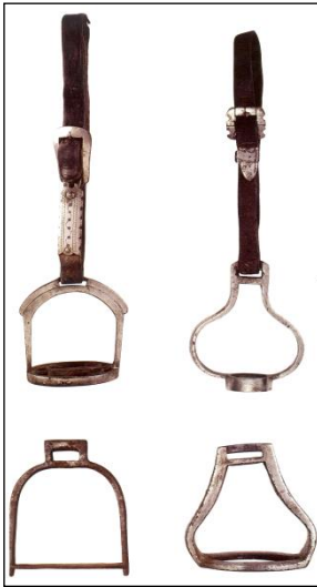
Resim 8:  z ng  ( zengi)

Binici tarafından istediėi gibi atı idare etmede ve y nlendirmede c g n olarak bilinen gemin (başlık) b y k bir yararı vardır (Resim 9). C g n , tizgin (dizgin) ve oozduk veya suuluk (aėızlık) olarak iki parçadan oluşur. Atın başına takılan gem, atın başının k  k ya da b y kl ėine g re daraltılıp veya geniřletilebilir. Bu arada atın başına ge irilen başlığın d řmemesi i in atın boėazına sagaldırık adı verilen boėaz kayışı takılır. Bundan sonra atın aėzı tarafındaki halka aracılıėıyla tizgin baėlanır. Tizgin , beyaz kayıştan yapılır ve 1,5 – 2 x 220 – 250 cm ebadında olabilir ( m rov, 2007, 32).