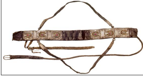
Resim 6: Basmayıl (kolan)