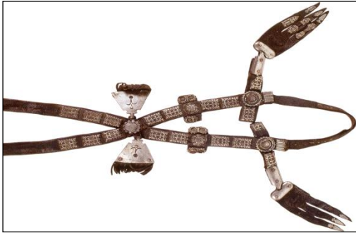
Resim 4: Kuyuşkan (kuskun)

At sırtına eer konulur konulmaz eerin arka kaşının iki yan tarafındaki halkaya çift kayışların birleştirilmesiyle bağlanmış olan kuyuşkan (Türkçe: kuskun), atın kuyruğuna takılır (Resim 4). Bu kuyuşkanın at üstündeki görevi, atın yürüyüşü esnasında eerin öne doğru kaymasını önler. Bu bağlamda kuyuşkanın eer i yerinde tutmada büyük bir yararı vardır. Bundan sonra eerin üstüne körpöçö veya köpçük olarak bilinen yumuşak bir malzeme konur (Resim 5). Ayrıca eere , ata bağlayan 150 x 10 cm ebadında ve kalınlığı 5 cm olan basmayıl olarak bilinen uzun enli kayış takılır. Basmayıl , örülmüş ve dokunmuş sağlam bir kayıştır (Resim 6). Basmayılın iki ucunda yay gibi demir ya da bakır halkaları olur. Bu halkaların birine ince kayış bağlanır. Bu kayış, ikinci halkaya bağlanarak eer sağlamlaştırılır. Sonra kayıştan örülmüş ve Kırgızcada kömöldürük olarak bilinen göğüslük eyerin ön kaşlarına takılır (Resim 7). Kömöldürük gösterişli bir şekilde saçaklı süslemelerle güzelleştirilerek yapılır. Kömöldürükün bir ucu atın ön göğsünden geçirilerek eerin diğer tarafındaki halkaya bağlanır ve atın göğsüne göre uzatılır veya kısaltılır. Kömöldürükün at omuzuna takılmasının sebebi, yokuşlarda eerin , at “ sooru ”su olarak bilinen arka tarafına doğru kaymasını önler (Ömüröv, 2007, 32).