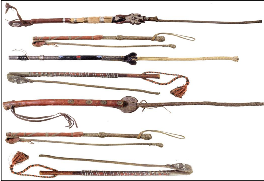
Resim 11: Kamçı Türleri

Binicinin yanında her zaman bulunması gereken bir diğer koşum tuşamış olarak bilinen ve atın kaçmaması için ayağına bağlanan köstektir. Tuşamış , sağlam bir ipten veya kayıştan 70 x 10 – 15 cm ebadında örülerek hazırlanır. Ancak tuşamış yerine atın çılıbrı olarak bilinen ip de kullanılabilir. Tuşamış her zaman binicinin yanında eerin arka tarafında kancığa adı verilen terki bağları ile bağlanarak taşınır. Tuşamış , at otlarken daha uzağa gitmemesi ve boşanıp kaçmaması için atın iki ayağına takılarak kullanılır. Kırgızlarda tuşamış ın birkaç türü vardır. Atın ön iki ayağına takılan tuşamışa – tuşamış saluu ; atın iki ön ayağı ile sol arka ayağına takılan tuşamışa – çider saluu (Resim 10); öndeki sol ayağı ile sol arka ayağındaki tuşamışa ise – öröölöp koyuu denilir (Ömüröv, 2007, 32).