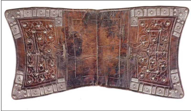
Resim 2: “Terdik” olarak bilinen süslü bir terlik

30 x 20 ebadında ve 5 – 10 cm kalınlığında olur. Bunun fonksiyonu, devamlı hareket halinde olan ve terliyen atın terini içine çekmek yani almaktır. Bu fonksiyonundan dolayı içmek olarak bilinen malzemenin üstüne konan malzeme “ terdik ” yani terlik olarak bilinir (Resim 2). 70 x 50 cm ebadında olan terdik , koyun yününden yapılan keçenin üzerine hayvan derisinin kapatılmasıyla elde edilir. Önceden terdik in kullanılış bakımından erkekler ve kadınlar için ayrı ayrı yapıldığı bilinmektedir. Terdiğin ön yüzü siyah, arka yüzü boz keçeden olup, üzerine kayış işlendikten sonra iki eteğine demirden ağaç şeklinde oyma yapılır. Varlıklı olan kimseler, bu oymanın üzerine gümüşten ince tabaka yaptırarak süsletirler. Hatta terdik lerin üzerine çeşitli renkli iplik işlemler ile karkıra kanat , karga tırmak (karga tırnağı), müyüz (boynuz), kıyal , kuş tumşuk (kuş burun) gibi oyma tasvirleri çizilerek yapılır. Ayrıca kız ve gelinler için, kunduz gibi kıymetli yabanî su hayvanının derileri çeşitli renkteki ipeklerle işlenerek terdik üzerine bastırılır. Terdik , atın üstüne konan eyerin altında en geniş malzemeyi teşkil eder. Terdik in fonksiyonu ise, atın sırtındaki eyerin ata rahatsızlık vermemesi ve Kırgızcada “ örköç ” olarak bilinen kamburunu yaralamamasıdır. Aksi halde atın sırtında coor veya cara denen “yağır” (yara) rahatsızlığı meydana gelebilir (Ömüröv, 2007, 32-33).