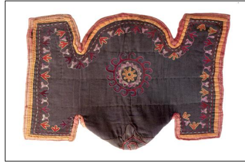
Resim 5: Körpöçö (köpçük)