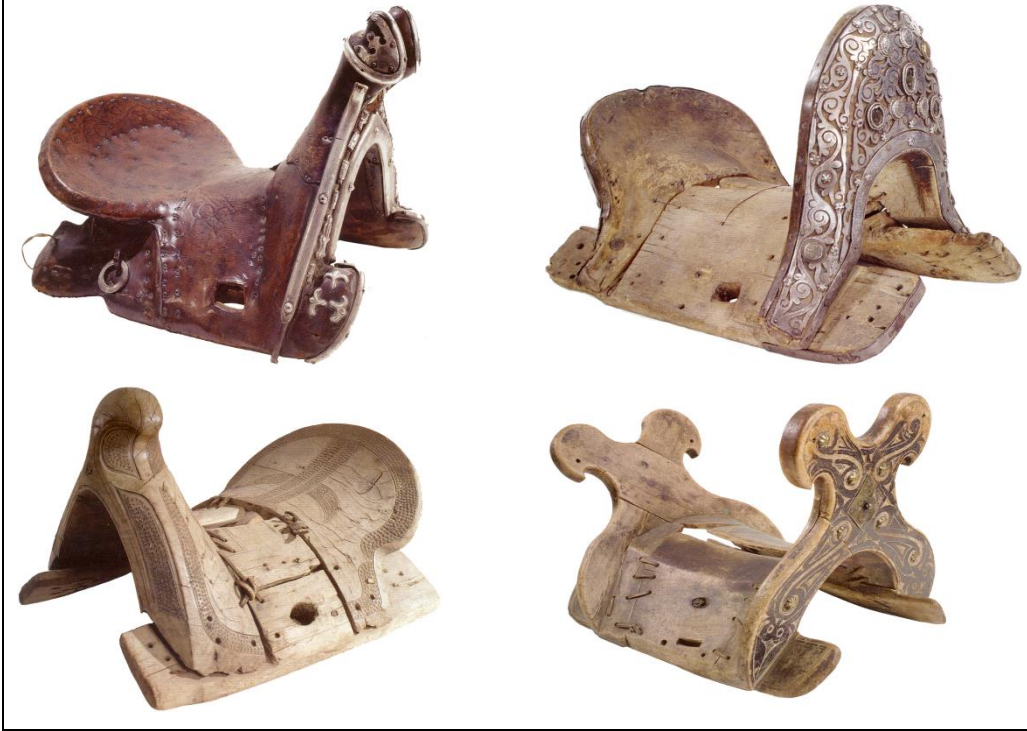
Resim 3: Eer türleri

Ak kañkı veya kuçmaç eer ve kalmak eer (kalmak eyer) adıyla bilinen eyerler Kırgız halkının destanlarında ve özellikle Manas Destanı'nda geçer. Baatırların kullandıkları ak kañkı eer ile kalmak eerin nasıl yapıldığı bilinmemekle birlikte, bu eerlerin askerî alanda kullanıldığı anlaşılıyor. Bu bağlamda Manas Destanı'nda adı geçen eerler ve bu eerlerle ilgili cügön (gem), kömöldürük (göğüslük), üzöngü (özengi), kuyuşkan (kuskun) gibi koşum takımlarının varlığı dikkati çeker. Bu bağlamda ak kañkı eer ile ilgili olarak: