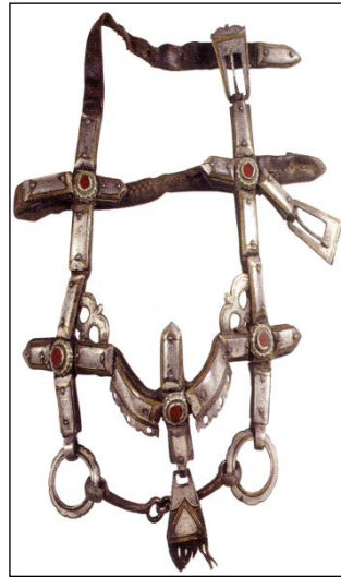
Resim 9: c g n (gem)